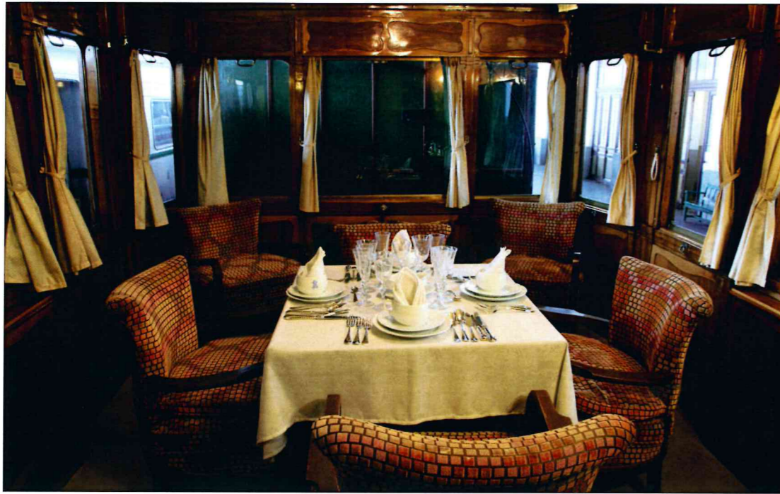
► Coche salón de 1946.

Bajo la impresionante marquesina de hierro y cristal está la nave central, en la que se ubica el espacio de andenes y vías donde se exponen las locomotoras, automotores y coches de viajeros, que constituyen la parte principal de la colección del museo y que, junto a otras piezas de menor tamaño, se dividen en locomotoras de vapor, desde las primitivas Patentee hasta las Confederación, consideradas como la culminación del vapor en nuestro país; las de tracción eléctrica, que circularon por España desde el último cuarto del siglo XIX hasta la década de los 60, y las de motor diésel, que se empezaron a utilizar en 1930, pero que no se perfeccionaron hasta 1950, cuando se introdujeron las de fabricación norteamericana, más potentes y que supusieron una alternativa al vapor cuando no era posible la electrificación de las vías.