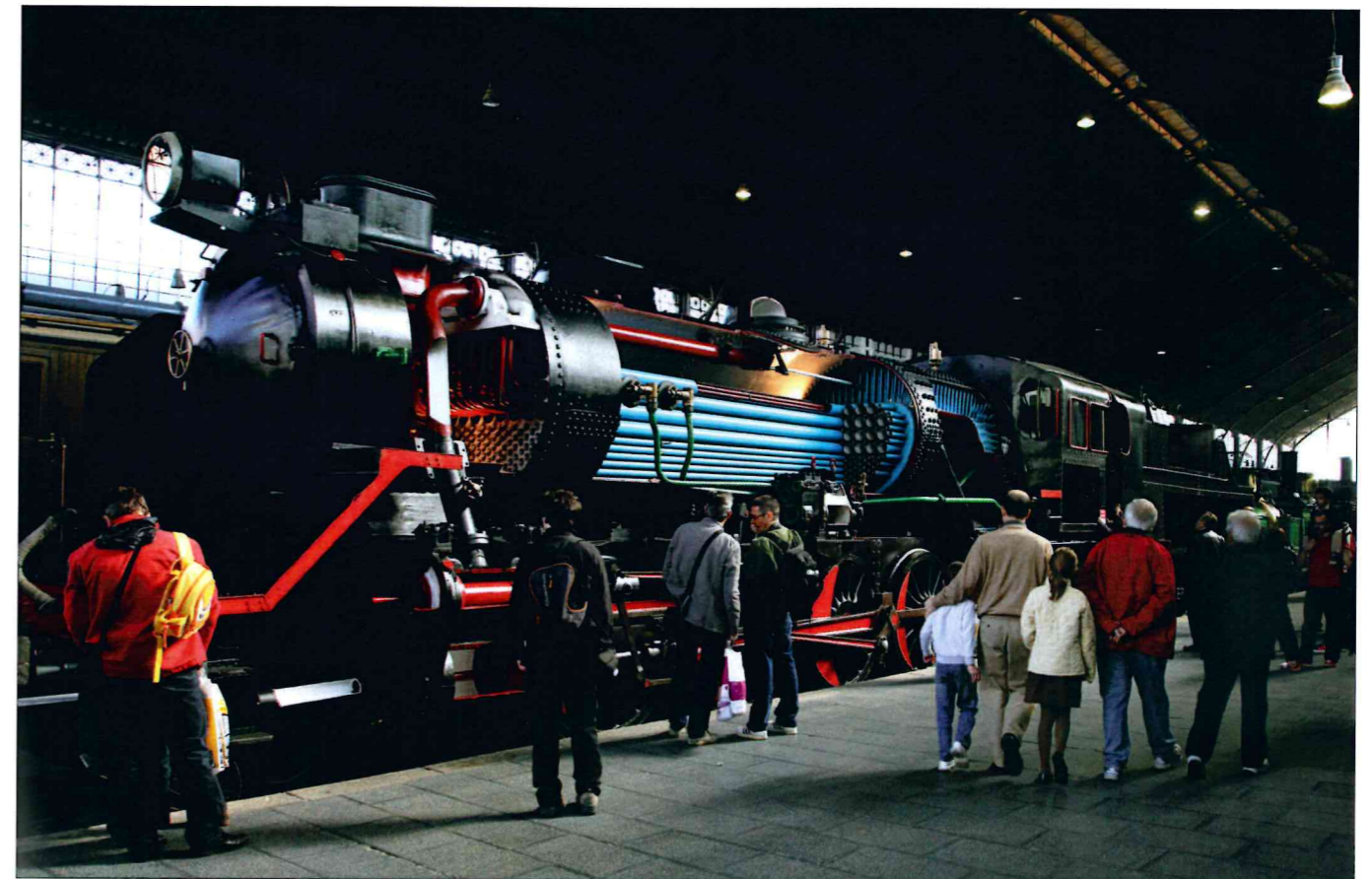
► Locomotora de vapor "El Alagón".

de sistemas. Además, también se hará referencia a la velocidad, la tecnología de integración, el material rodante, la infraestructura y la construcción de una línea de alta velocidad.