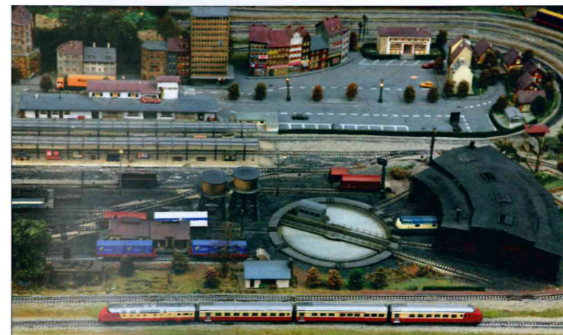
► Visita de público a uno de los trenes de la colección. Debajo, una de las maquetas expuestas.

miniatura circulan por vías, puentes, túneles e instalaciones ferroviarias que nos permiten descubrir una representación a escala de la realidad. Curiosamente, la aparición del ferrocarril dio un gran impulso al mundo del modelismo, ya que en paralelo a su evolución surgió un gran entusiasmo por la fabricación de juguetes y maquetas que evocaban este medio de transporte, y que a día de hoy es un pasatiempo para millones de aficionados en todo el mundo.