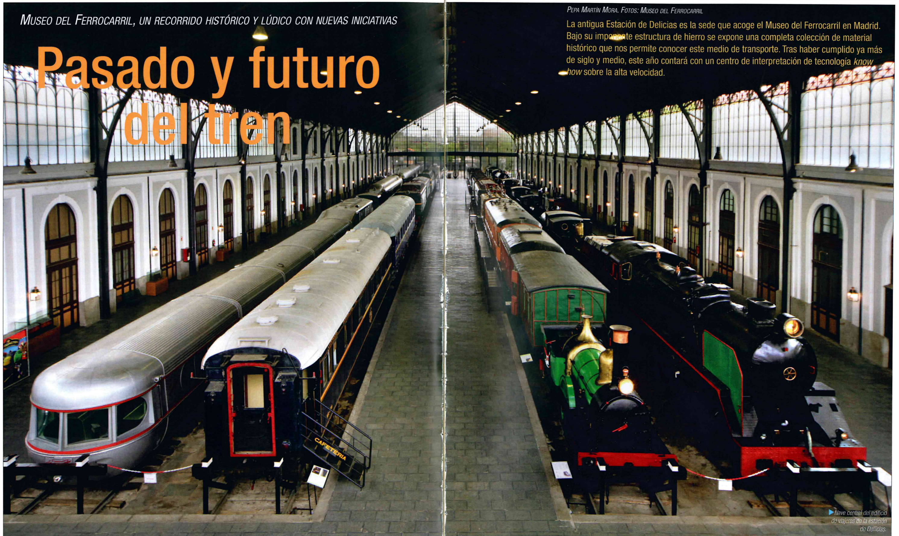
► Nave central del edificio de viajeros de la estación de Delicias.

La antigua Estación de Delicias es la sede que acoge el Museo del Ferrocarril en Madrid. Bajo su imponente estructura de hierro se expone una completa colección de material histórico que nos permite conocer este medio de transporte. Tras haber cumplido ya más de siglo y medio, este año contará con un centro de interpretación de tecnología know how sobre la alta velocidad.