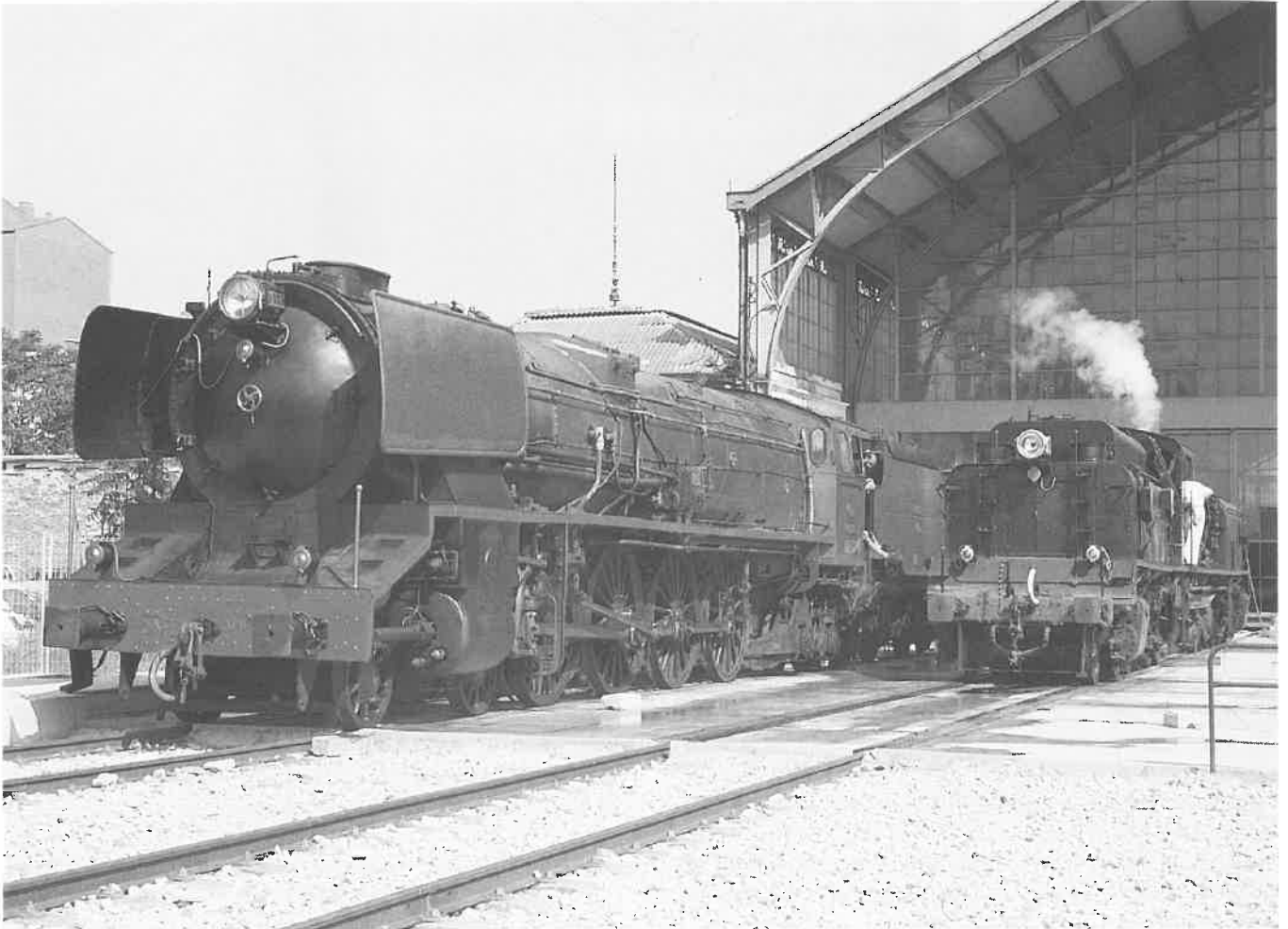
LOCOMOTORAS DE VAPOR, CONFEDERACIÓN Y GARRAT, ENCENDIDAS EN UN DÍA DE JORNADA DE PUERTAS ABIERTAS.