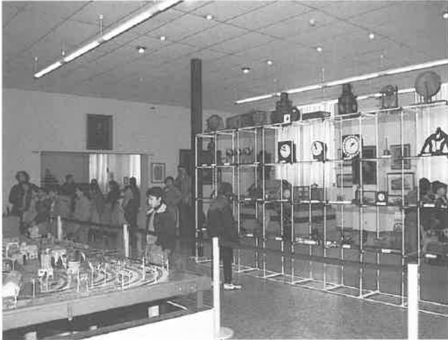
SALA DE MODELISMO FERROVIARIO, DONDE SE APRECIA LA COLECCIÓN DE FAROLES.

Componen esta exposición 31 vehículos entre los que destacan locomotoras con sistema de funcionamiento diferente: vapor, eléctrico y diesel, así como coches de viajeros (restaurantes, salón, primera clase, tercera, etc.).