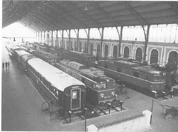
VISTA GENERAL DE LA SALA DE TRACCIÓN DEL MUSEO.

Posteriormente, y siempre a partir de 1948, comenzó por parte de los creadores del Museo una búsqueda de material antiguo que pudiera engrosar sus fondos, de igual manera quedaba establecido que todo el material que quedara en desuso pasara a formar parte del Museo, pero estas iniciativas se hicieron de una forma lenta y no con la regularidad deseada. Sería a partir de 1975, año del fin de la tracción a vapor en España, cuando se rescatará la mayor parte de los fondos de locomotoras, sobre todo de vapor, que posee el Museo. Durante estos años, hasta 1980, todo el material rescatado se ubicó en la Estación de Príncipe Pío, que por aquel entonces se encontraba en proceso de restauración y, por tanto, cerrada al tráfico.